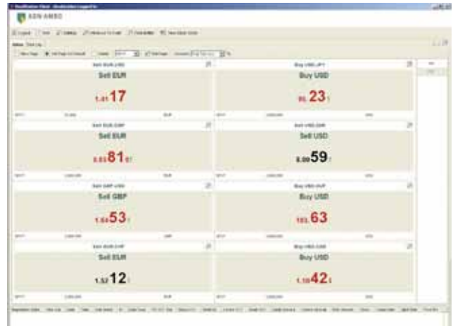
Live market data

DealStation biedt u tal van interessante mogelijkheden. Zo kunt u de uitgevoerde transacties bekijken en met de geavanceerde transactieopvraag- en archieffuncties rapporten op maat samenstellen. Ook is het mogelijk zoeksjablonen te creëren om regelmatig terugkerende zoekopdrachten te vereenvoudigen en te versnellen. Zodra de nieuwe transacties zijn vastgelegd, worden deze sjablonen bijgewerkt.